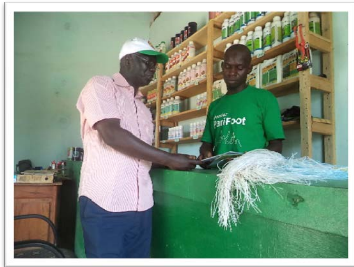
Remise de document d'information à 2 vendeurs de pesticides : Source DPV Suivi des pesticides 2015