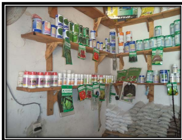
Magasin de stockage de pesticides Source Rapport Bureau Législation de pesticides 2015

Dans le domaine du contrôle, les vendeurs de pesticides sont régulièrement contrôlé (3 fois/an en moyenne) par les services de la DPV notamment sur l'autorisation d'exercer, la date de péremption, les normes techniques, l'emballage, l'environnement de stockage). Pour pallier le problème de trafics illicites et l'insuffisance d'inspecteurs, la DPV forme les responsables aux frontières (douaniers, contrôleurs au port) dans le domaine des pesticides. De plus, la DPV appuie la structuration et l'organisation d'une interprofession à travers des sessions de formation et des émissions sur les radios communautaires. Pour beaucoup de producteurs et de vendeurs, la forte concentration de matières actives dans le pesticide est synonyme d'efficacité du produit. L'interprofession pourrait jouer un rôle d'éveil des consciences sur le danger que peut représenter les pesticides.