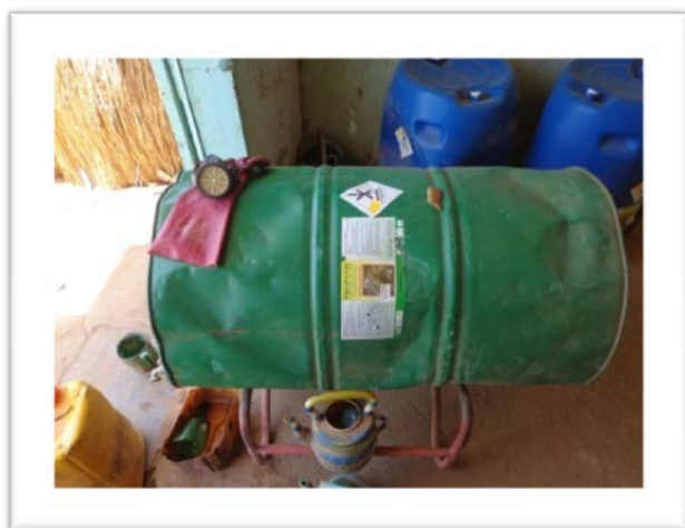
Vente de pesticide au détail : Source Rapport Suivi des pesticides 2015